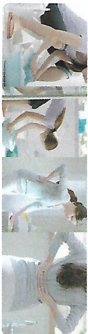
สตรีตั้งครรภ์ทุกท่านจะมีการเปลี่ยนแปลงโครงสร้างสรีระ แต่วิถีชีวิตไม่เปลี่ยนแปลง

จากการศึกษาข้อมูลงานวิจัย พบว่า หญิงตั้งครรภ์ก่อนกำหนดเป็นหญิงกลุ่มวิจัยทำงาน เช่น ค้าขาย เกษตรกรรม รับจ้าง เป็นต้น และต้องทำหน้าที่เป็นแม่บ้านอีกด้วย เช่น ล้างจาน ทำความสะอาดบ้าน หุงข้าว ทำกับข้าว ซักผ้าและรีดผ้าเลี้ยงบุตรคนโต เป็นต้น พฤติกรรมบางอย่าง เช่น เปลี่ยนท่านั่งของเป็นท่ายืนบ่อยครั้ง เดินขึ้นบันไดหลายครั้งต่อวัน หากต้องเดินทางมาทำงานทุกวันไม่ว่าโดยสารถ้วยพาหนะใดใด เช่น มอเตอร์ไซด์ จักรยาน รถเมล์ รถไฟฟ้า เป็นต้น หากการเดินทางนั้นต้องเกร็งบริเวณหน้าท้องบ่อยครั้ง เมื่อยหลัง หรือวิ่งอยู่บนถนนที่ขรุขระเป็นประจำบ่อยครั้ง อาจเกิดการกระทบกระเทือนต่อบุตรในครรภ์ก่อให้เกิดอาการเจ็บครรภ์ก่อนกำหนด ซึ่งยังไม่รวมถึงพฤติกรรมขณะทำงาน เช่น การกลั้นปัสสาวะ การนั่งหรือยืนทำงานนานๆ ความเครียดจากการทำงาน เป็นต้น หากสตรีตั้งครรภ์เผชิญปัญหาหลายด้าน สิ่งเหล่านี้ก่อให้เกิดความเครียด เห็นอย่างชัดๆ ทำให้ประสิทธิภาพการทำงานลดลงและยังทำให้มีอาการไม่สุขสบาย ได้แก่ เวียนหัว ปวดศีรษะ ปวดหลัง ชาขาวม อารมณ์หดหู่ เหนื่อยล้า หงุดหงิด เป็นต้น นำไปสู่ การแท้ง การคลอดก่อนกำหนด ทารกน้ำหนักน้อย (อ้างถึง คุณสุภาพพร แสงศรี)